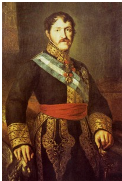
El infante Carlos

No obstante el Infante Carlos María Isidro, hermano de Fernando, no aceptó esta decisión y, creyéndose con mejores derechos para ocupar el trono que su sobrina Isabel, se exilió a Portugal para poder contactar con sus adeptos y preparar la lucha armada.