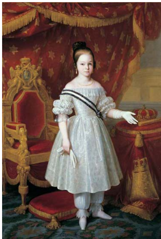
La reina Isabel II cuando era niña.

Siendo anciano el Rey y no teniendo otra descendencia que su hija Isabel, de corta edad, promulgó un decreto que derogaba la ley Sálica y nombraba heredera a su hija. También establecía que hasta la mayoría de edad de la niña, ocuparía el trono su madre, la Regente María Cristina.