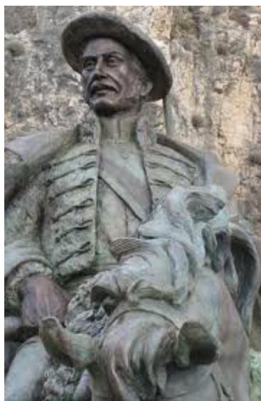
El general carlista Cabrera