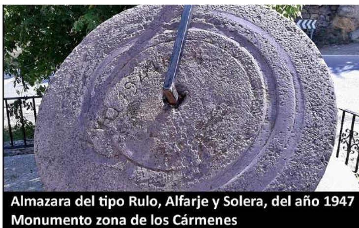
Almazara del tipo Rulo, Alfarje y Solera, del año 1947 Monumento zona de los Cármenes

En 1914 según el Anuario Batlles sabemos quienes eran sus propietarios y añadimos un dato nuevo, sabemos (continúa en la página siguiente)