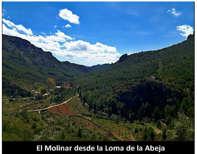
El Molinar desde la Loma de la Abeja

Desde el Molinar tomaremos el camino que lleva hacia El Toro hasta llegar al "Taconar". Desde allí cambio de sentido y empezaremos a subir a la parte más alta de la excursión, la Loma de la Abeja (1181 m.). No es una montaña muy conocida pero nos va a ofrecer unas vistas impresionantes de la zona, nacimiento del Palancia, Barranco del Resinero, Peña Juliana y Peñaescabia. Bajaremos hasta el Collado del Cascajar (vistas a la Rambla Seca) y más tarde seguiremos una senda que alguien limpió (muchas gracias) y que nos llevará de vuelta al Molinar con el Palancia a nuestros pies y la Peñaescabia siempre en lo alto. Os esperamos a todos los que queráis pasar una mañana diferente en contacto con la naturaleza.