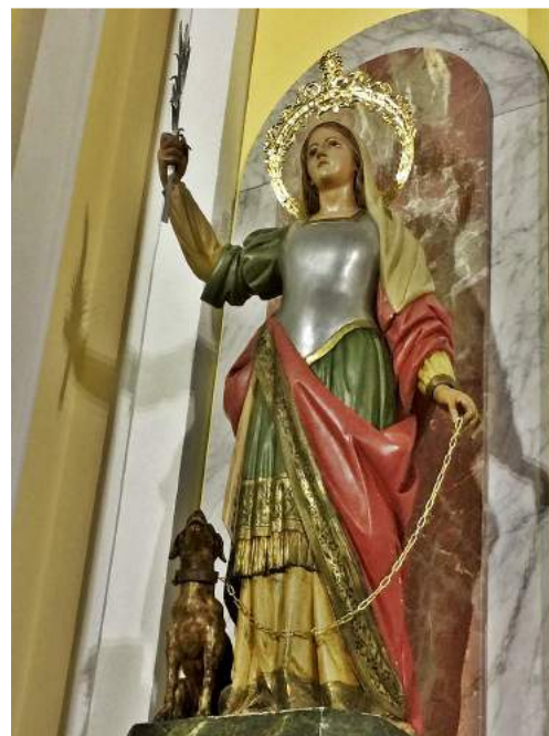
Iglesia de Torás

Existen otras versiones sobre su nacimiento y muerte y es reivindicada por otros países. Los portugueses hacen a la santa portuguesa, nacida en Braga y sitúan su muerte en Pombiero, cerca de Coimbra. Algunos estudiosos dicen que su cuerpo fue trasladado a la iglesia de San Pedro en Aire Sur l'Adour (Francia), donde se encuentra su sarcófago, del siglo IV, y supuestamente, parte de sus reliquias.