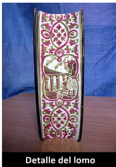
Detalle del lomo

Esperamos que la decisión de su compra originada en la Asociación Cultural detoras.es y refrendada por el alcalde del Excelentísimo Ayuntamiento de Torás, sirva de honra y disfrute del pueblo de Torás, que cumple así con la deuda histórica de contar entre sus reliquias con la obra más importante de D. Antonio Ponz Piquer nacido en la Masía de la Cerrada de Torás.