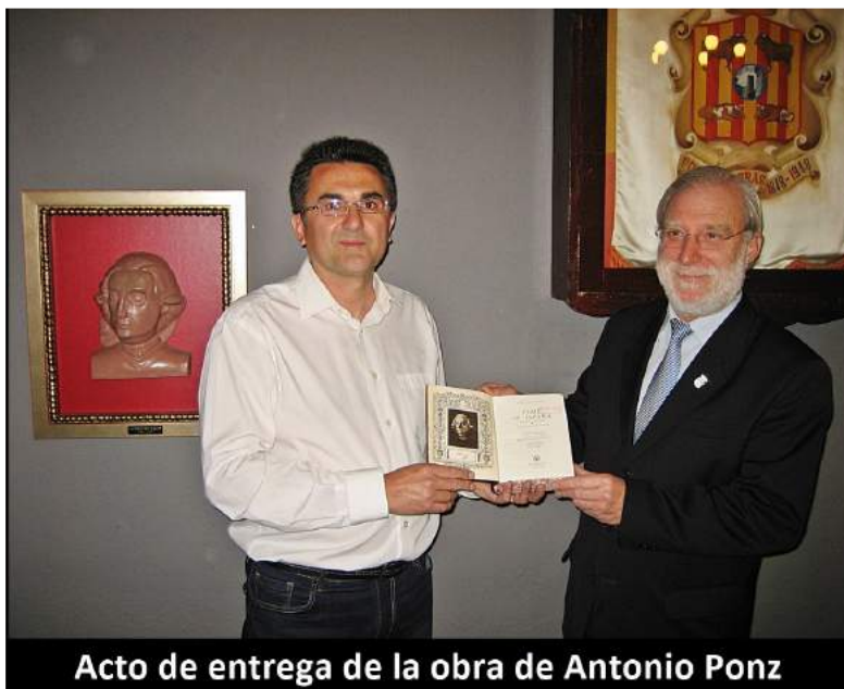
Acto de entrega de la obra de Antonio Ponz

Dicha obra es un compendio en un solo tomo de los 18 tomos de la obra "Viage de España" seguidos de los 2 tomos de "Viage fuera de España", en total son 20 tomos compendiados en uno solo. Es de la editorial Aguilar de Madrid del año 1947, consta de 2039 páginas y lleva introducción e índices del prestigioso historiador y archivero D. Casto María del Rivero. Las tapas son en piel y los lomos están decorados en color a dos tintas con figuras vistosas. Una edición antigua pero muy cuidada y