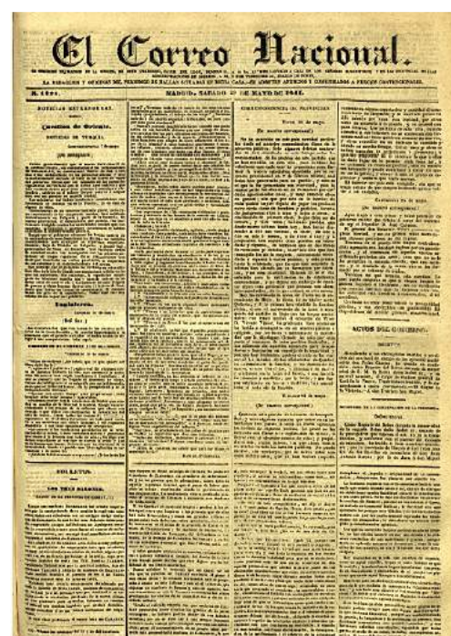
Portada de "El Correo Nacional" de 29 de mayo de 1841