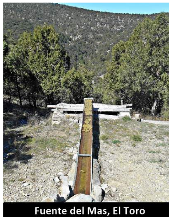
Fuente del Mas, El Toro

Vuelta por el mismo camino y sobre las tres de la tarde ya estábamos saboreando un plato de embutido del terreno en la antigua Casa Botija de El Toro. Hasta la próxima.