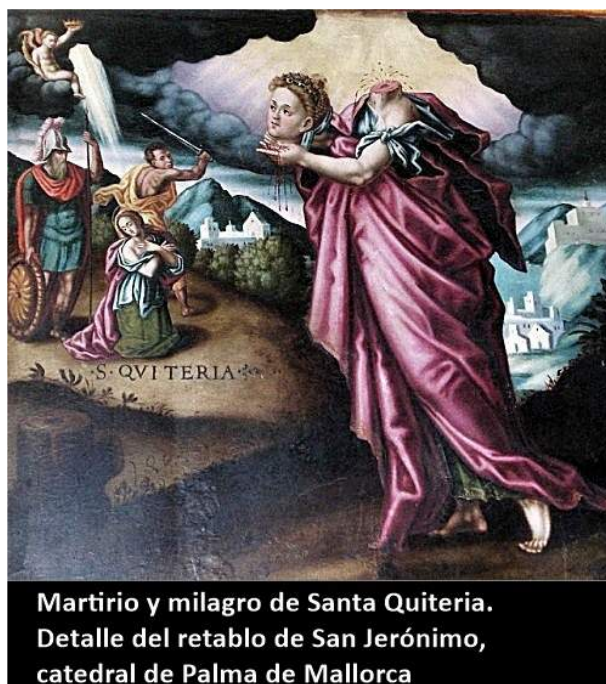
Martirio y milagro de Santa Quiteria. Detalle del retablo de San Jerónimo, catedral de Palma de Mallorca