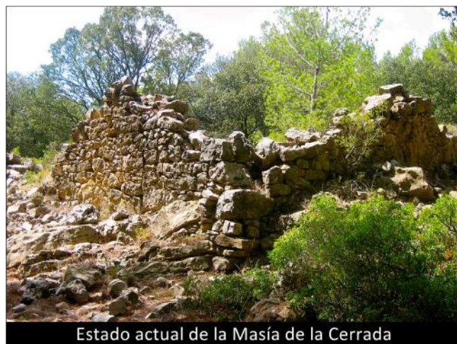
Estado actual de la Masía de la Cerrada

WGS84 Geográficas, Lon. 00°41'14.30" W Lat. 39°56'51.00" N