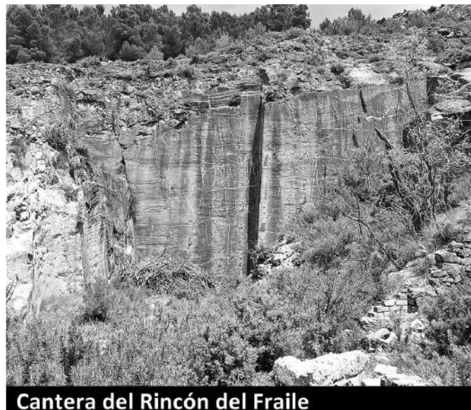
Cantera del Rincón del Fraile

Mineralogía. La Cantera del Rincón del Fraile se encuentra en uno de los diversos afloramientos de doleritas o diabasas (rocas subvolcánicas) que posee el término de Torás. Se denominan rocas subvolcánicas porque se formaron a partir de un magma que aunque nunca salió al exterior, se enfrió a muy poca profundidad. Posteriormente, por ascensión tectónica salieron a la superficie. La menor consistencia (y por tanto menor dureza) que presenta esta diabasa en el Rincón del Fraile, debido a un elevado grado de alteración, fue el motivo de la localización de la explotación a diferencia de otros afloramientos como por ejemplo la Cantera de los Arenales (también subvolcánica). Los coleccionistas de minerales, en su escombrera pueden encontrar masas de Hematites micáceo, Calcopirita, Cuarzos de color azul verdoso muy deteriorados y ya muy difícilmente, agrupaciones de cuarzos incoloros, en ocasiones casi hialinos (completamente transparentes).