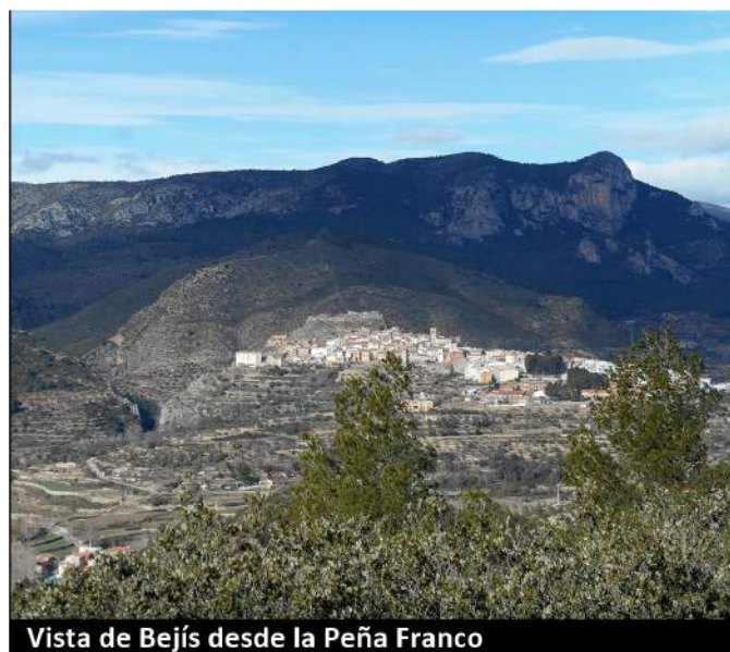
Vista de Bejís desde la Peña Franco