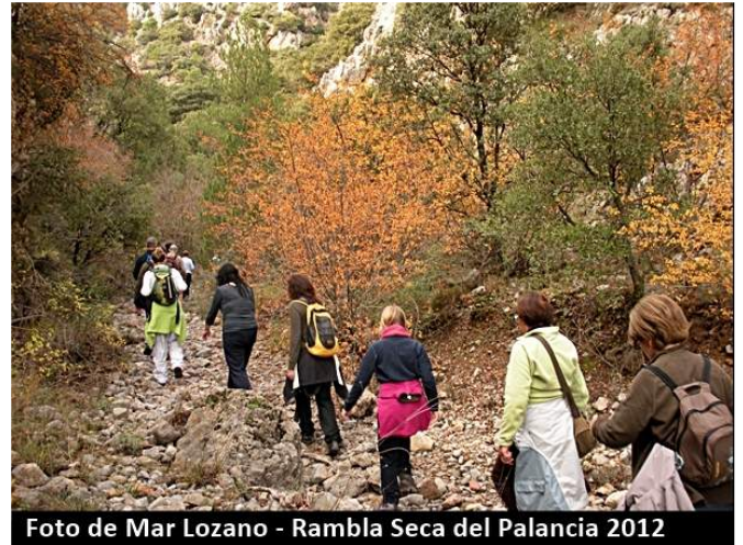
Rambla Seca del Palancia 2012

poco más de dos horas. En este tramo se alcanzará el alto de la Loma de la Abeja desde el que, si tenemos suerte con el tiempo y la visibilidad, esperamos poder disfrutar de la vista del mar al fondo. Bajaremos hasta un mirador con vistas al valle del Palancia y Peña Escabia y atravesaremos el cauce de un barranco de gran belleza. Una vez alcanzado de nuevo el Toconal, los participantes de la ruta corta regresarán a El Toro en coche y el resto regresarán caminando por una pista. Finalizada la ruta se podrá comer en el restaurante Suizo II de El Toro. Para ello se deberá confirmar, como tarde, a la hora del almuerzo. Todos los detalles ampliados de la ruta, mapa, recomendaciones, etc... se pueden consultar en la página web detoras.es. Animaros a participar, os esperamos.