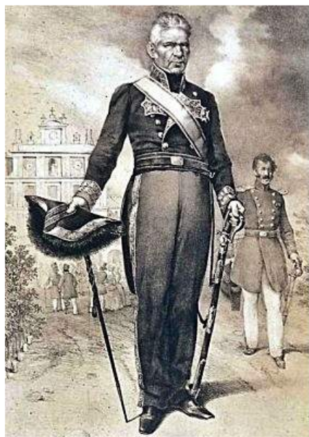
D. Pedro Villacampa y Maza de Lizana (1)

Enfrentamiento de las tropas francesas contra el general español D. Pedro Villacampa y Maza de Lizana.